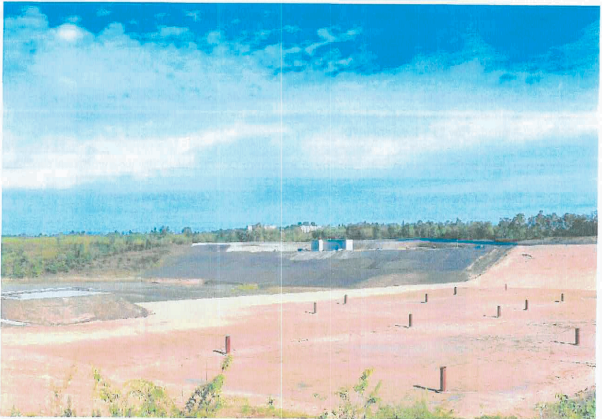
Przewidywany termin zakończenia inwestycji 26.10.2021r.