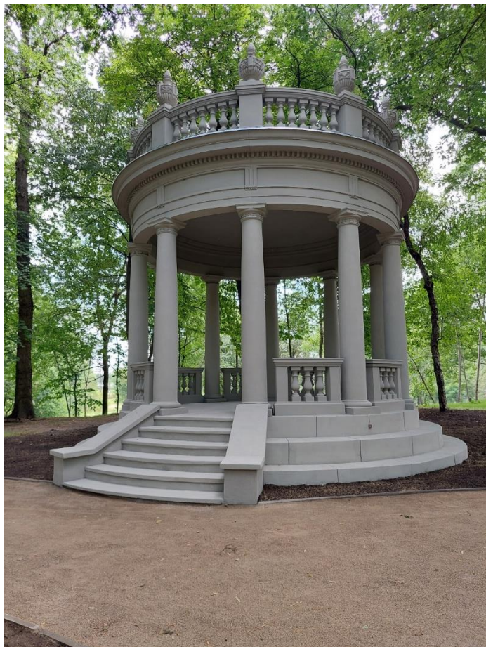
* Perła Pogoni - przywrócenie dawnego blasku w Parku Dietla (BO22/II/1)