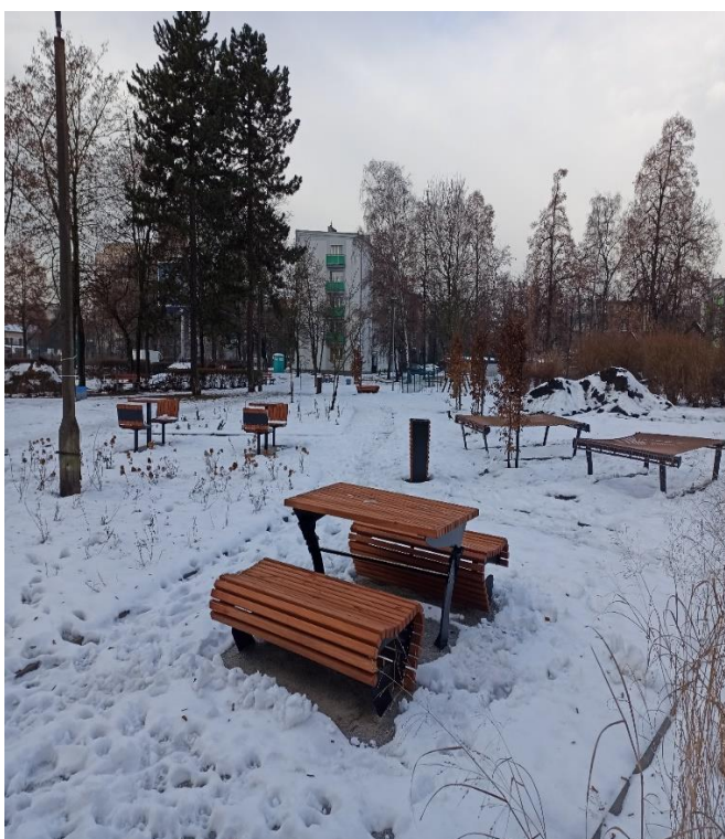
* ParKing wypoczynkowy czyli ogród literacki z placem piknikowym. Metamorfoza zaniedbanego skweru. Etap I - ul. Piłsudskiego (BO22/III/3)