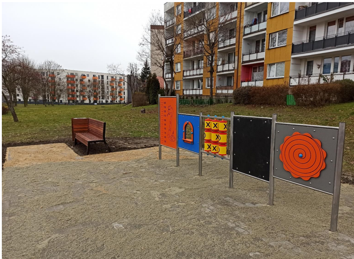
* Ścieżka kreatywna - ul. Kielecka (BO22/VIII/2)