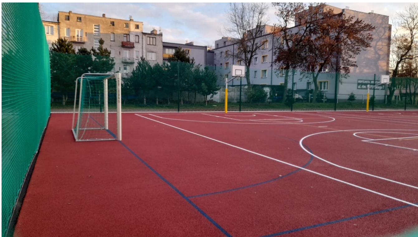
* Modernizacja bazy rekreacyjno-sportowej przy Szkole Podstawowej nr 4 w Sosnowcu