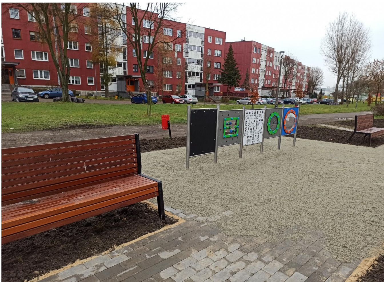
* Ścieżka kreatywna - ul. Kielecka (BO22/VIII/2)