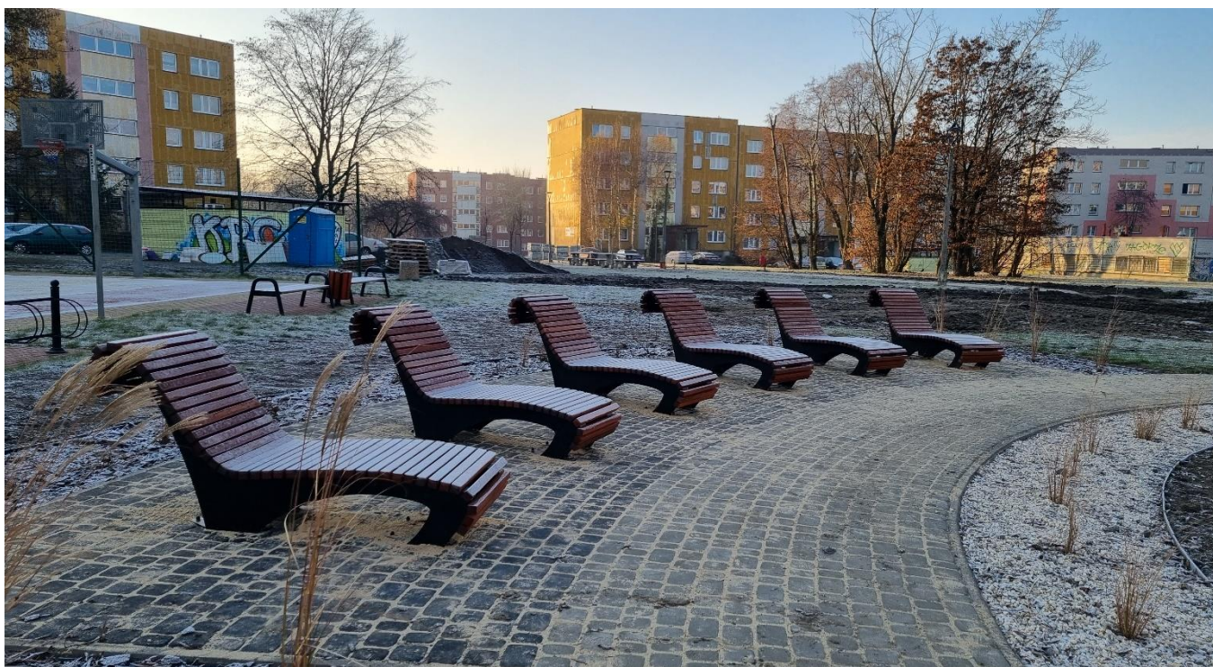
* Zielony skwer - ul. Kielecka (BO22/VIII/1)