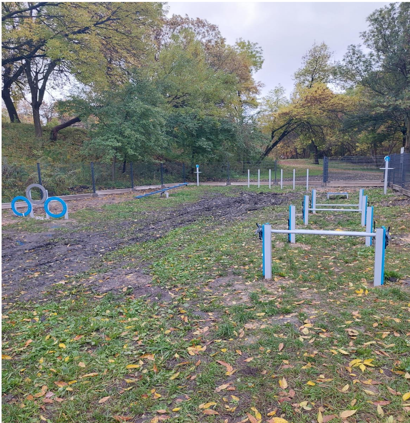
* Rewitalizacja parku przy ul. Okrzei (BO22/IV/1)