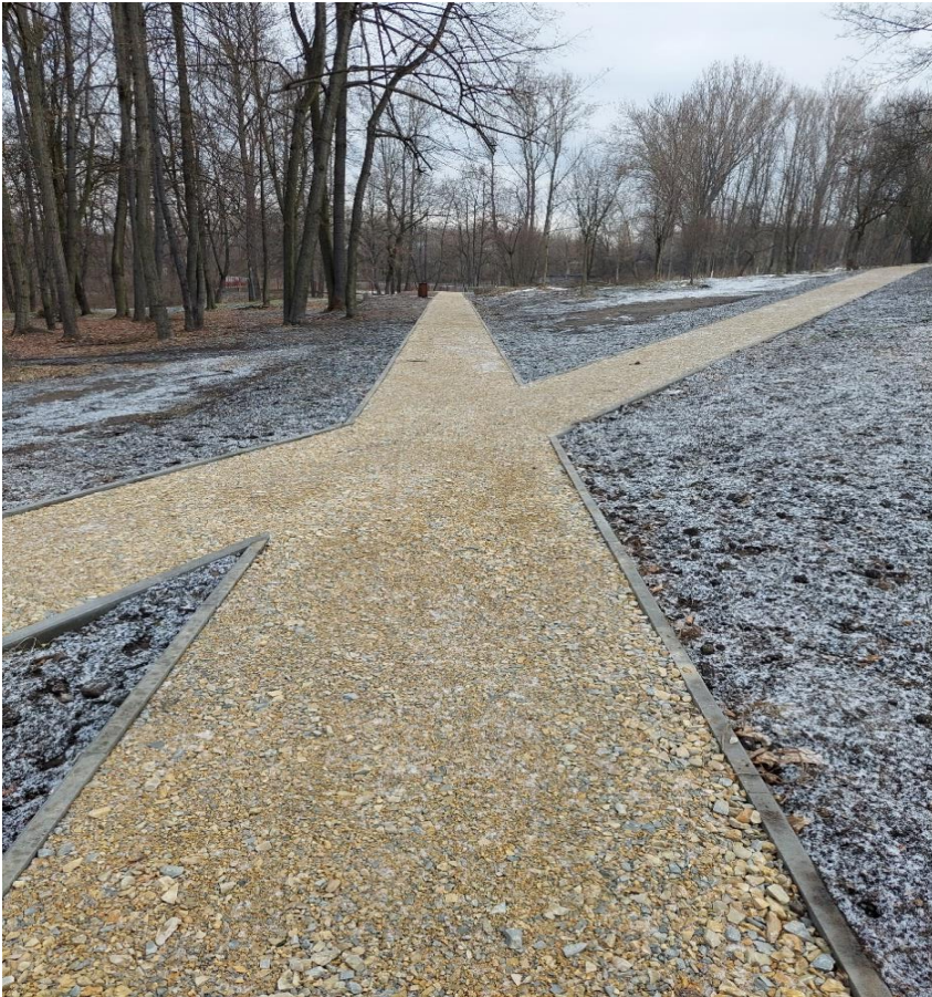
* Rewitalizacja parku przy ul. Okrzei (BO22/IV/1)