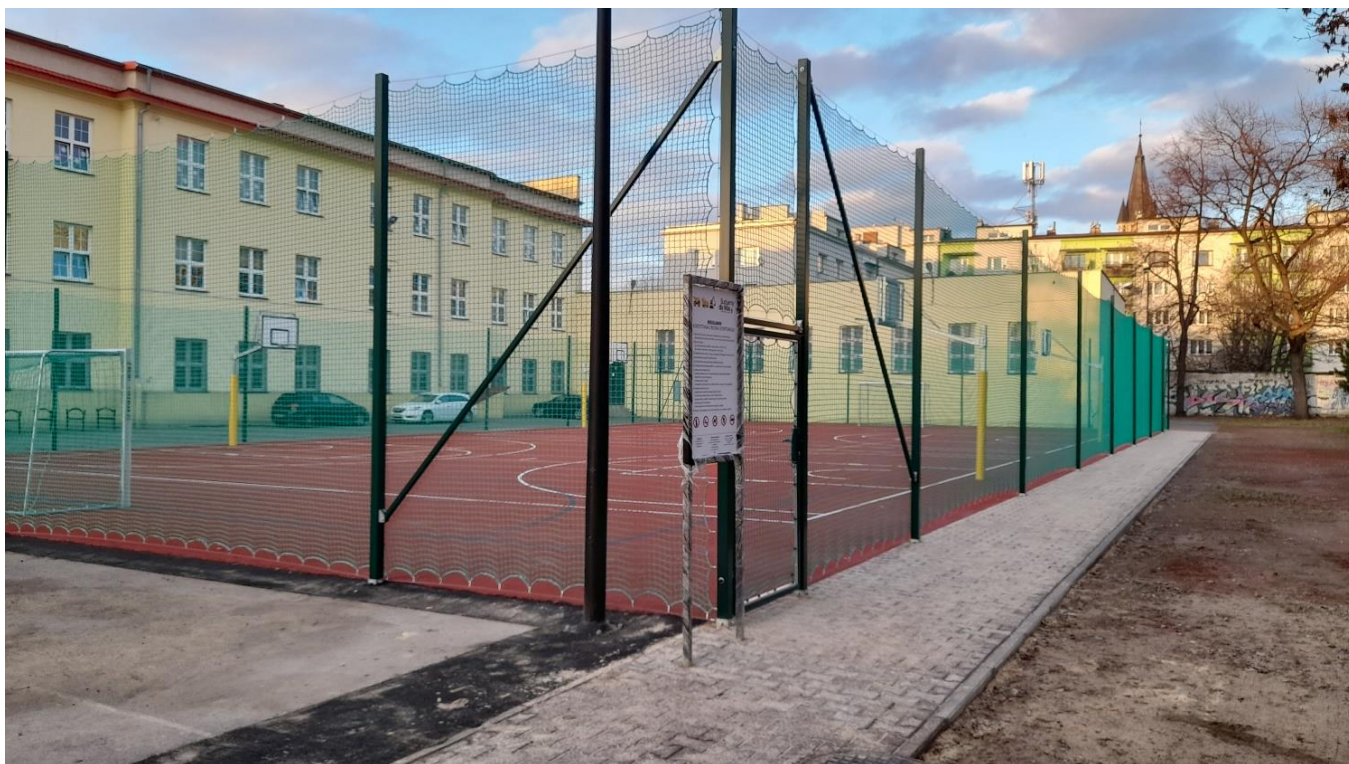
* Modernizacja bazy rekreacyjno-sportowej przy Szkole Podstawowej nr 4 w Sosnowcu