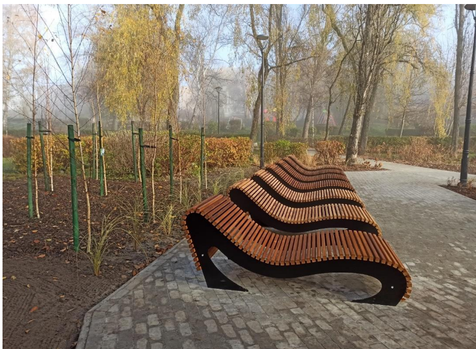
• Międzypokoleniowa strefa relaksu - Zagórze Park Kępa (BO22/VII/3)