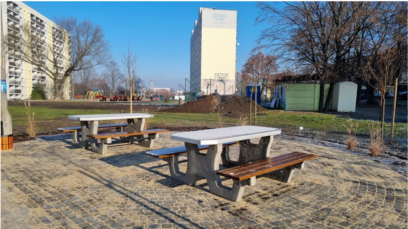
* Zielony skwer - ul. Kielecka (BO22/VIII/1)