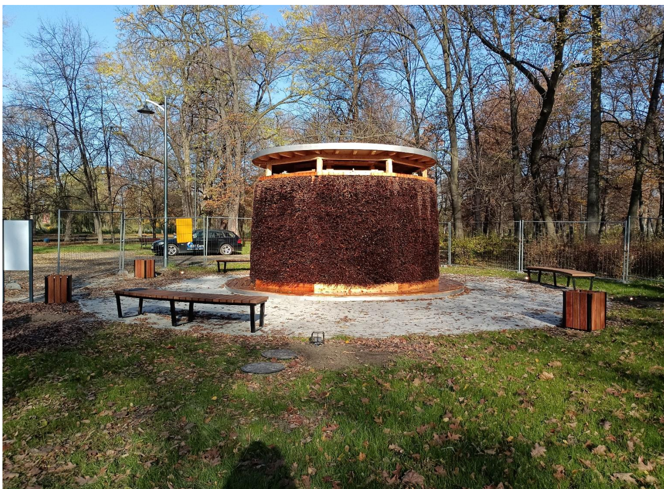
* Tężnia solankowa w Parku Sieleckim - Zdrowie i wypoczynek dla wszystkich (BO21/O/22)