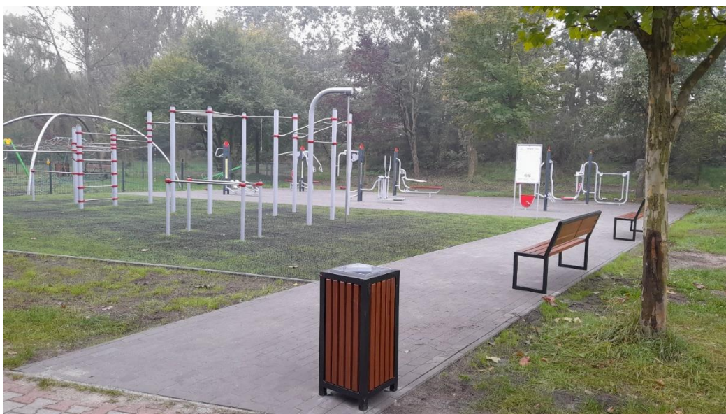
* Strefa sportu w parku na osiedlu Kalety (BO22/I/2)