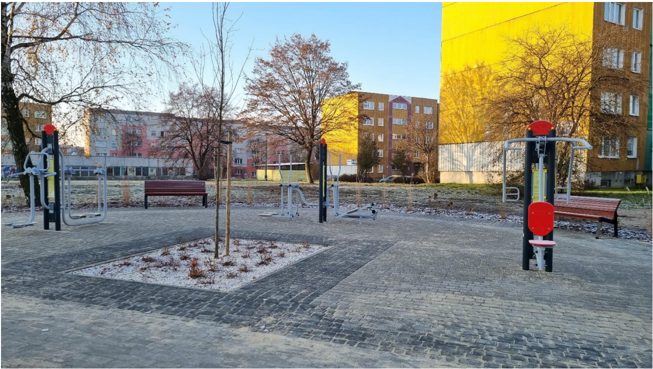
* Zielony skwer - ul. Kielecka (BO22/VIII/1)