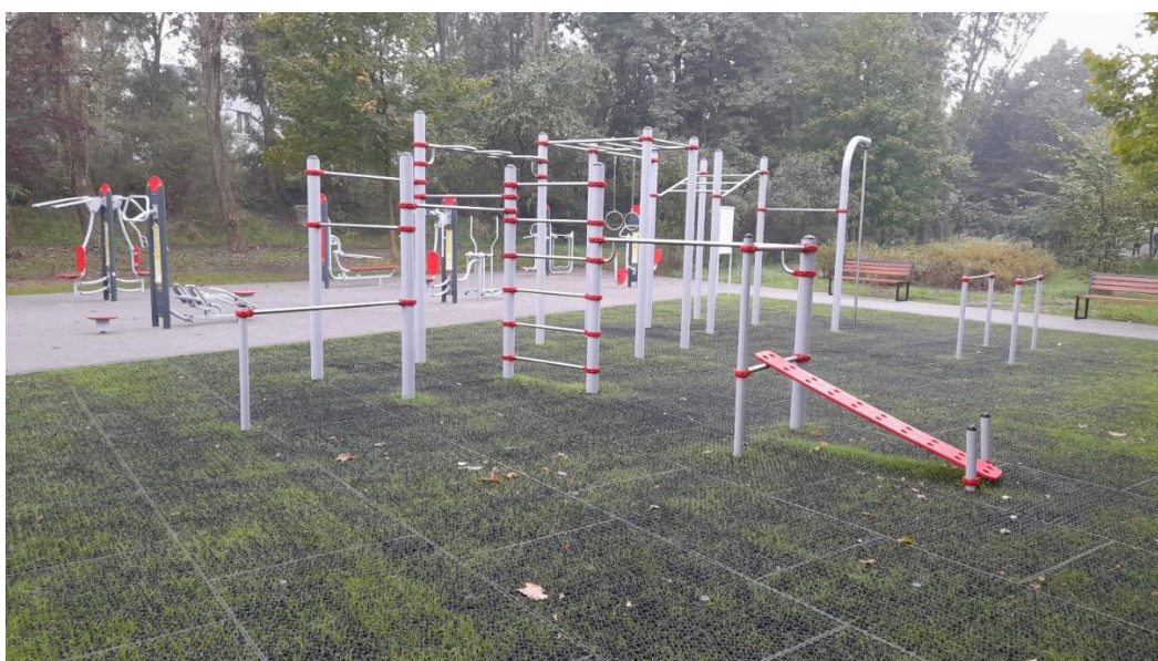
* Strefa sportu w parku na osiedlu Kalety (BO22/I/2)