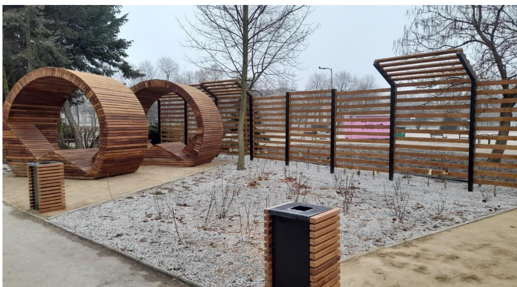
* Wygodne siedziska przy Tężni Solankowej i rzece w Parku Sieleckim (BO22/V/7)