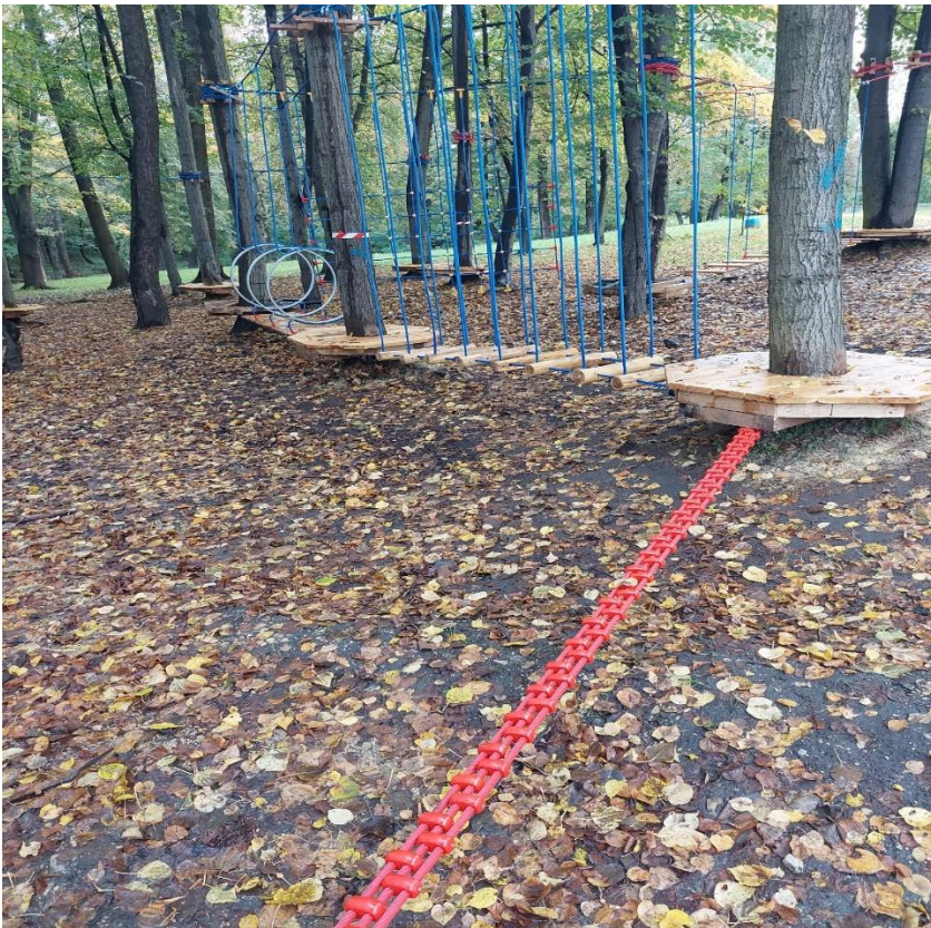
* Rewitalizacja parku przy ul. Okrzei (BO22/IV/1)