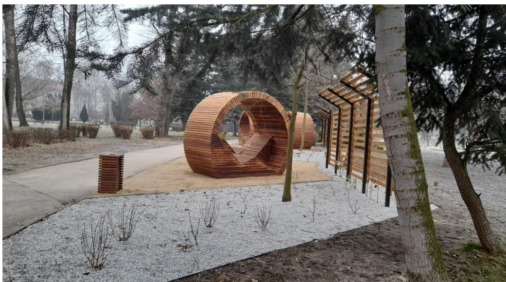
* Wygodne siedziska przy Tężni Solankowej i rzece w Parku Sieleckim (BO22/V/7)