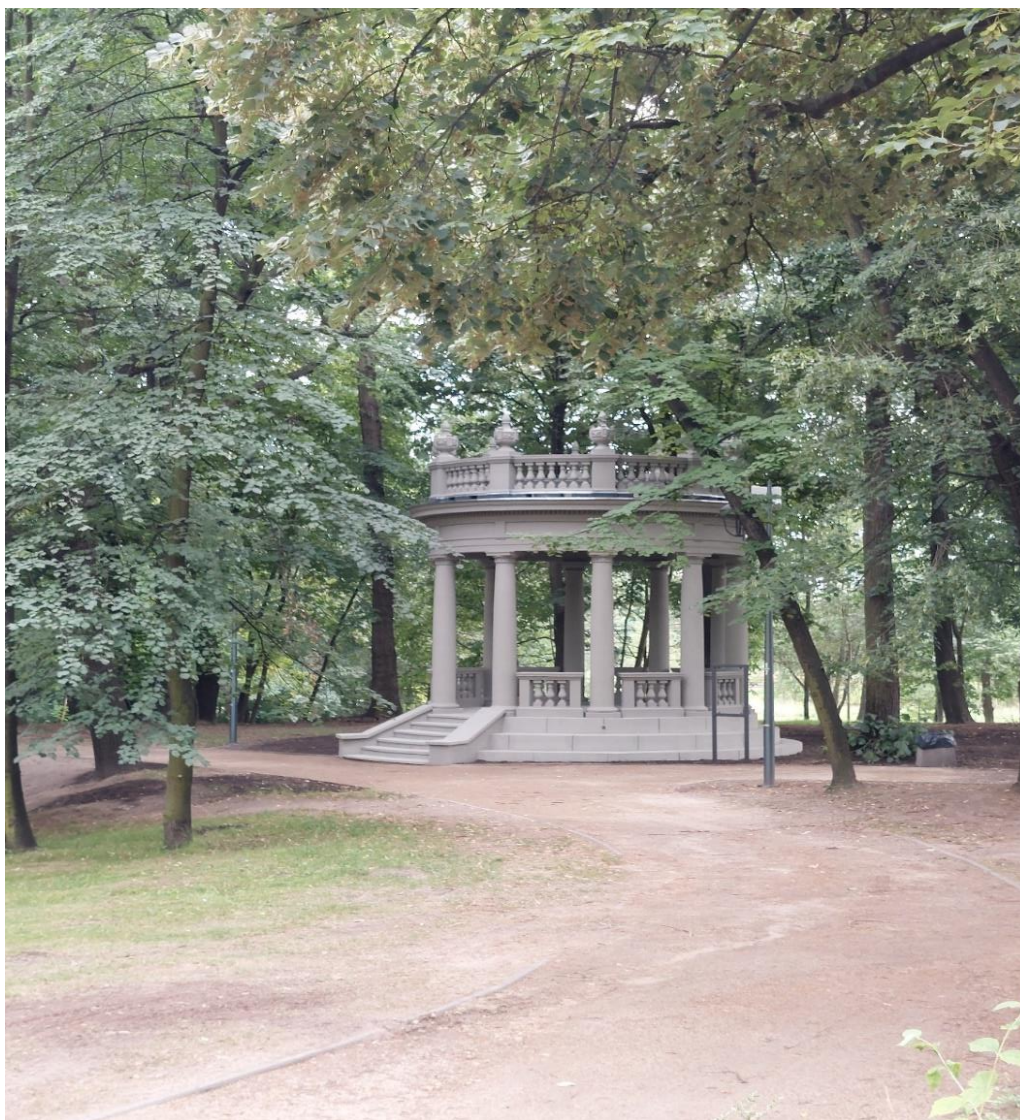
* Perła Pogoni - przywrócenie dawnego blasku w Parku Dietla (BO22/II/1)