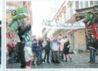
Proaktywne Akcja przeciwko paleniu śmieci

Spalanie śmieci w domowych piecach daje złudne oszczędności. Piacisz zdrowiem! Trujesz dzieci, skazując je na choroby górnych dróg oddechowych, astmę i alergie. 28 000 Polaków, co roku umiera z powodu zanieczyszczonego powietrza (Raport Komisji Europejskiej, 2005 rok).