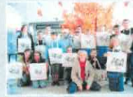
Edukacyjne Tędy ekologiczne wykonano na wierzchołku