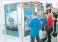
Infograficzna Promocja wystawy w Orlim Śmieci w Bielsku-Białym

Fundacja Ekologiczna ARKA skt. poczt. 525 43-301 Bielsko-Biała 1 tel. 33 919 46 53 e-mail: fundacjaarka@fundacjaarka.pl