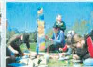
Dziecięcy Warsztat na Spalanie Dziel Śmieci