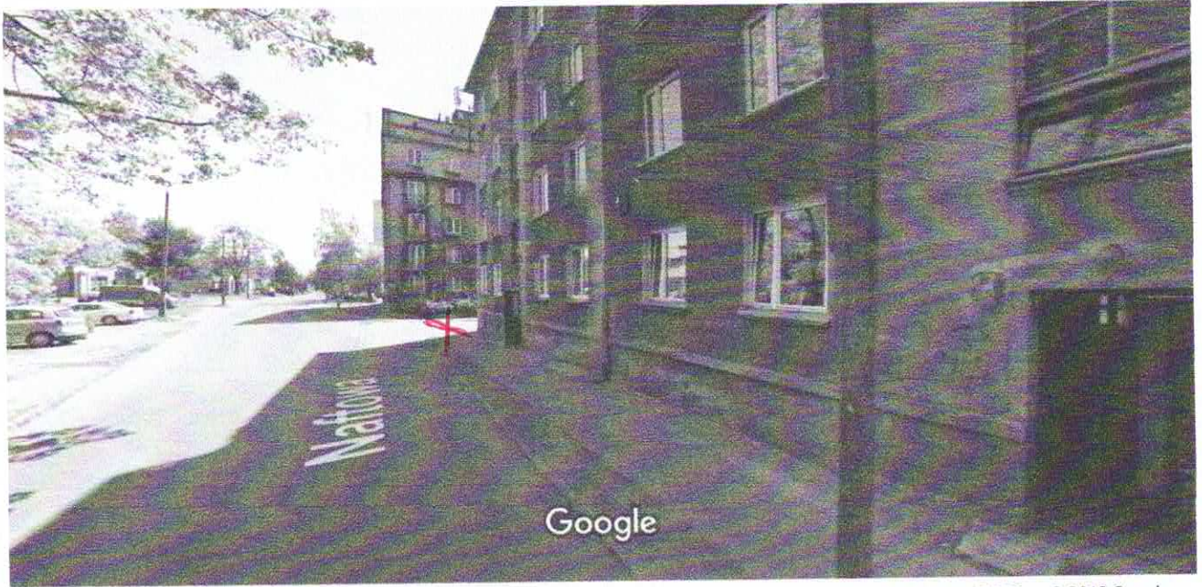
Data zdjęcia: maj 2017