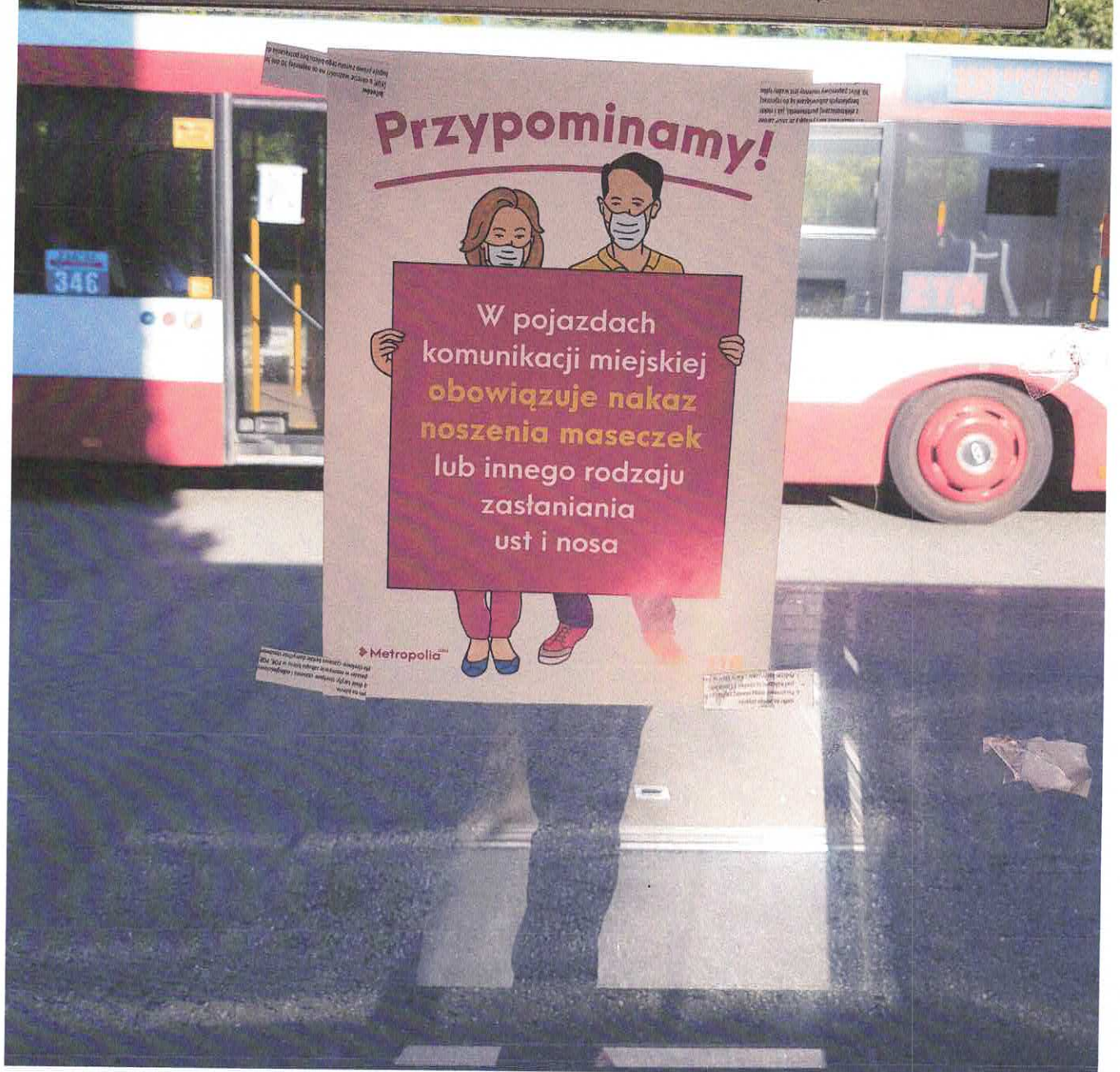
Fot.1 Informacja dla pasażerów o obowiązku zastaniania ust i nosa w komunikacji miejskiej

Informacje źródłowe na temat Regionalnego Programu Operacyjnego Województwa Śląskiego na lata 2007-2013 znajdują się na stronie www.rpo.slaskie.pl