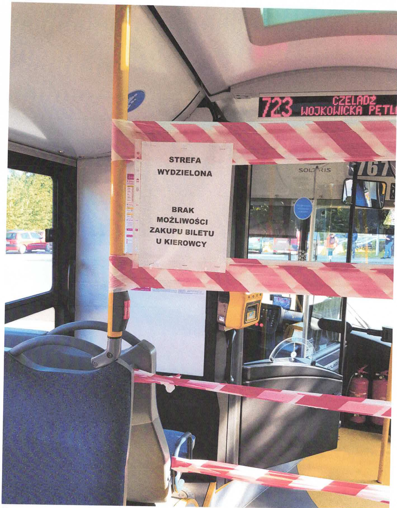
Fot.4 Wydzielona strefa bezpieczeństwa kierowcy