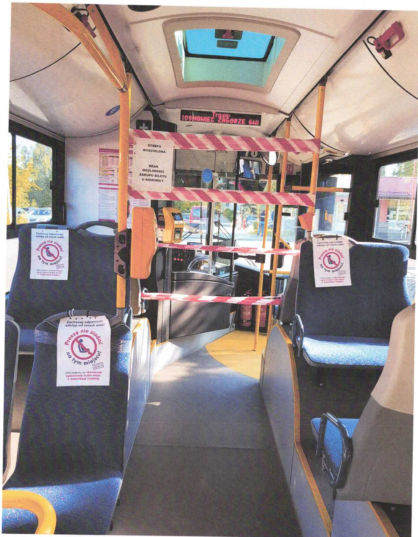
Fot. 5. Informacja na fotelach pasażerskich zapewniająca odstęp między podróżującymi