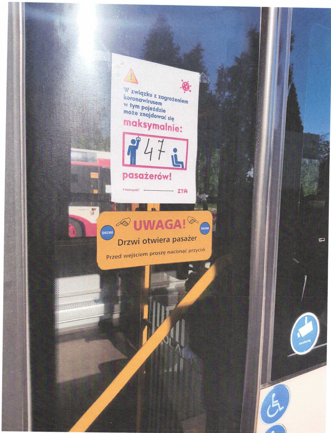
Fot.2 Informacja dla pasażerów o dopuszczalnej ilości miejsc w autobusie