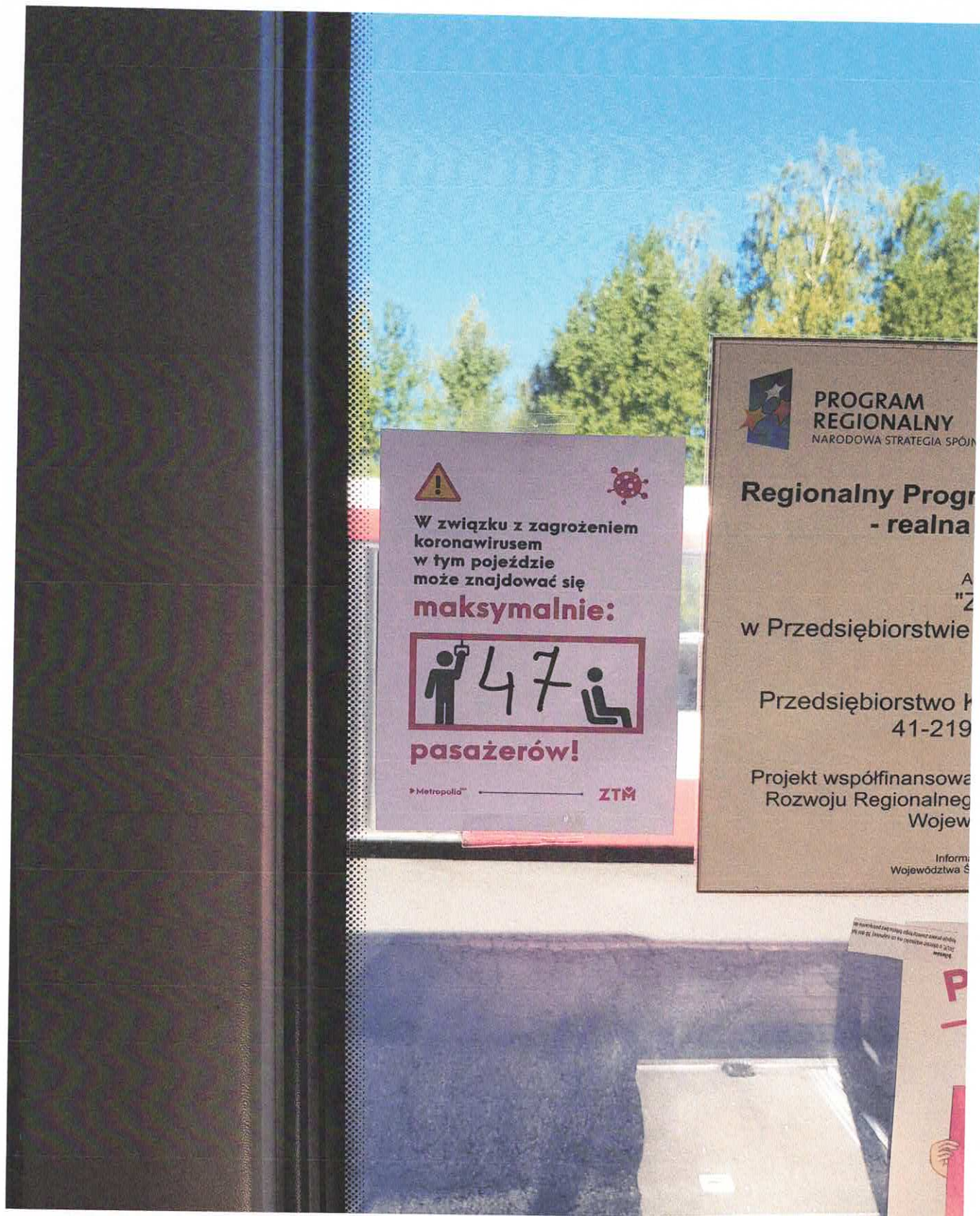
Fot.3 Informacja dla pasażerów o dopuszczalnej ilości miejsc w autobusie - umieszczona wewnątrz pojazdu